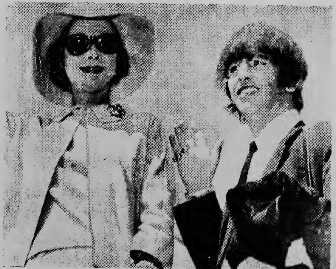
Ringo Starr tabata vialha huntu cu e actriz Vivien Leigh a bordo [redacted] qu a sali di Londres pa Australia. Despues di sufrir un enfermedad, Ringo a recupera den un [redacted] na Londres y a bu[redacted] ba Australia caminda Beatles ta realizando un gira.

DALLAS, 17 Juni.- Barry Goldwater, e senador derecho di arizona a bisa den un discurso di campanya electoral cu e ta capaz pa hiba un partido republicano uni na victoria den e eleccionnan presidencial na november awor. El a bisa asina en coneccion cu e miedu di e republicanonan mas modera cu un eleccion di Goldwater como candidato pa republicanonan, lo pone hopi republicano perde e oportunidad di haya un asiento den congreso.